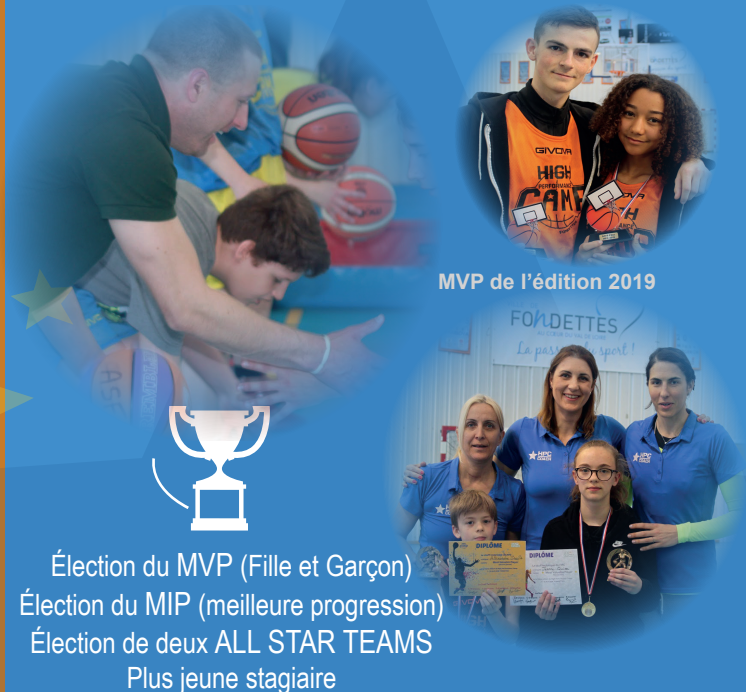
MVP de l'édition 2019

Élection du MVP (Fille et Garçon) Élection du MIP (meilleure progression) Élection de deux ALL STAR TEAMS Plus jeune stagiaire